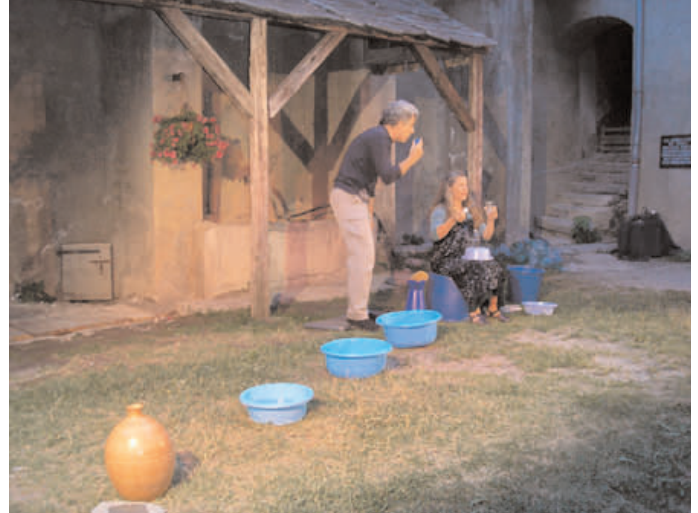
“H2o” dans le cadre de la “semaine de l'Eau”, au Parc Naturel Régional du Queyras – ARVIEUX (05) en juillet 06.

PRODUIT PAR LA COMPAGNIE BAGAGES D'ACTEURS