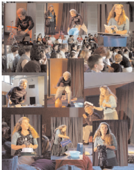
"H2o..." présenté lors de l'Eco-Forum de Fontvieille en mai 06