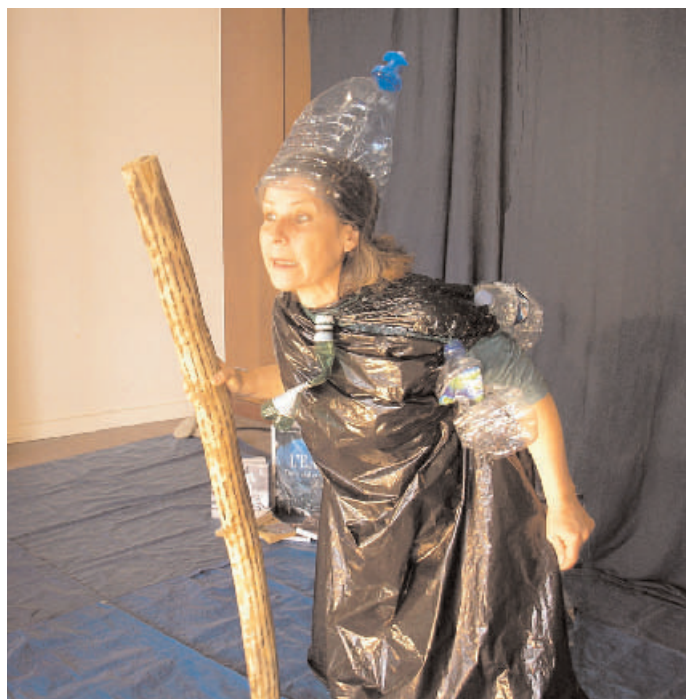
Pignat, mars 2006, Photo P Coudsi

LE SPECTACLE EST POUR TOUT PUBLIC, ENFANTS À PARTIR DE 10 ANS